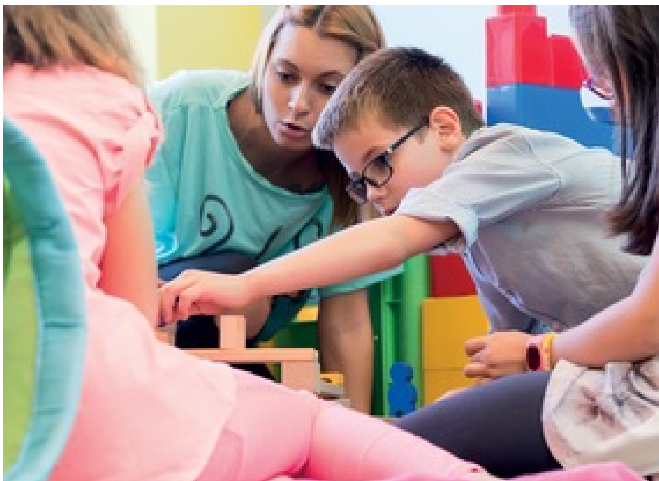
DEVENIR ASSISTANT MATERNEL