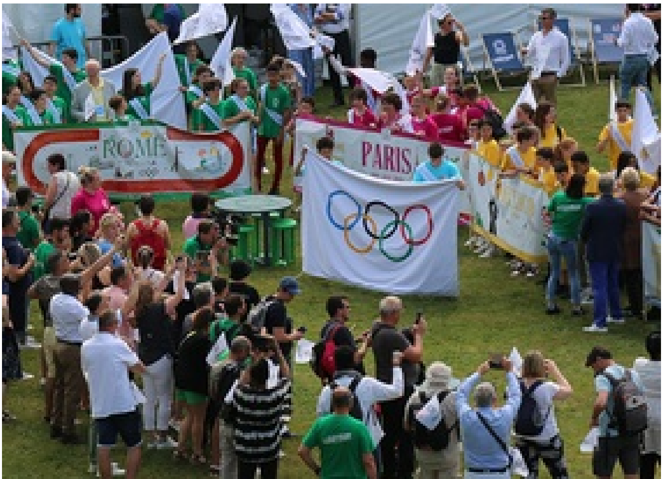
LES ÉVÈNEMENTS OISE24